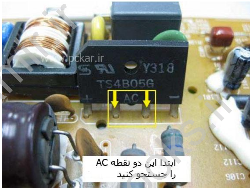
شکل ۱۱.۱ - دو پایه AC پل دیود را مشخص کنید

پراب های مولتی متر را روی ۲ ورودی AC پل دیود قرار دهید، جهت پراب ها مهم نیست (ولتاژ AC قطبیت (پلاریته) ندارد). پراب های مولتی متر را محکم بگیرید تا سر نخورده و به پایه های دیگر اتصالی نکند. در غیر این صورت ممکن است فیوز بسوزد و صدای بلند "بنگ" ایجاد شود که باعث ترس شما خواهد شد.