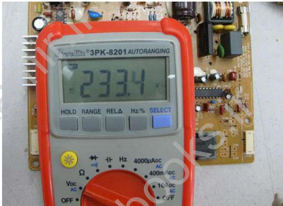
شکل ۱۱.۳ - نتیجه آزمایش

اگر مولتی متر ۲۳۰ ولت AC نشان داد پس ثابت می شود که ولتاژ AC که از ورودی AC وارد می شود سالم است. اگر صفر ولت وجود داشت (یا ولتاژ بسیار پایین بود) پس مجبورید مدار را قبل از پل دیود بررسی کنید. اگر ولتاژ AC در پل دیود وجود نداشت مشکلات احتمالی زیر را بررسی کنید: