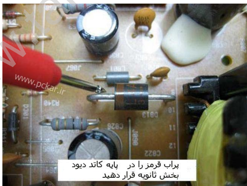
شکل ۱۱.۹ - نحوه صحیح قرار دادن پراب قرمز برای بررسی ولتاژهای مثبت SMPS

نکته: اگر دیود خروجی در جهت مخالف روی برد قرار دارد، پس پراب قرمز را به آند دیود وصل کنید در حالی که هنوز پراب مشکی با زمین سرد تماس دارد. در این حالت باید انتظار ولتاژ منفی را داشته باشید. همانطور که در شکل ۱۱.۱۰ دیده می شود. لطفا در زمان آزمایش، پراب قرمز را در بخش کاتد دیود قرار ندهید چون اکنون بخش کاتد دیود به ولتاژ AC با پالس بالا که توسط ترانسفورمر SMPS تولید شده وصل است.