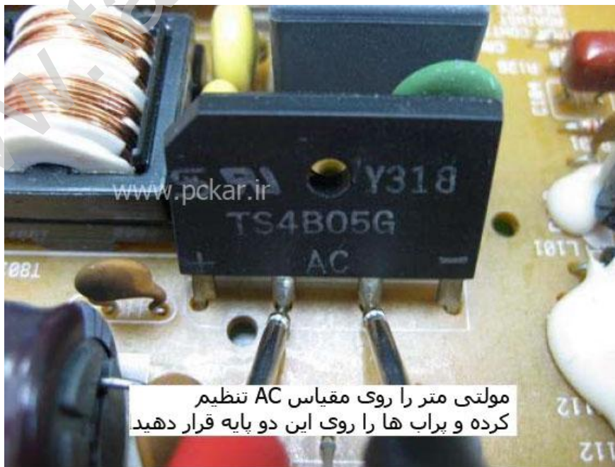
شکل ۱۱.۲ - پراب ها را در نقاط صحیح قرار دهید

پراب های مولتی متر را روی ۲ ورودی AC پل دیود قرار دهید، جهت پراب ها مهم نیست (ولتاژ AC قطبیت (پلاریته) ندارد). پراب های مولتی متر را محکم بگیرید تا سر نخورده و به پایه های دیگر اتصالی نکند. در غیر این صورت ممکن است فیوز بسوزد و صدای بلند "بنگ" ایجاد شود که باعث ترس شما خواهد شد.